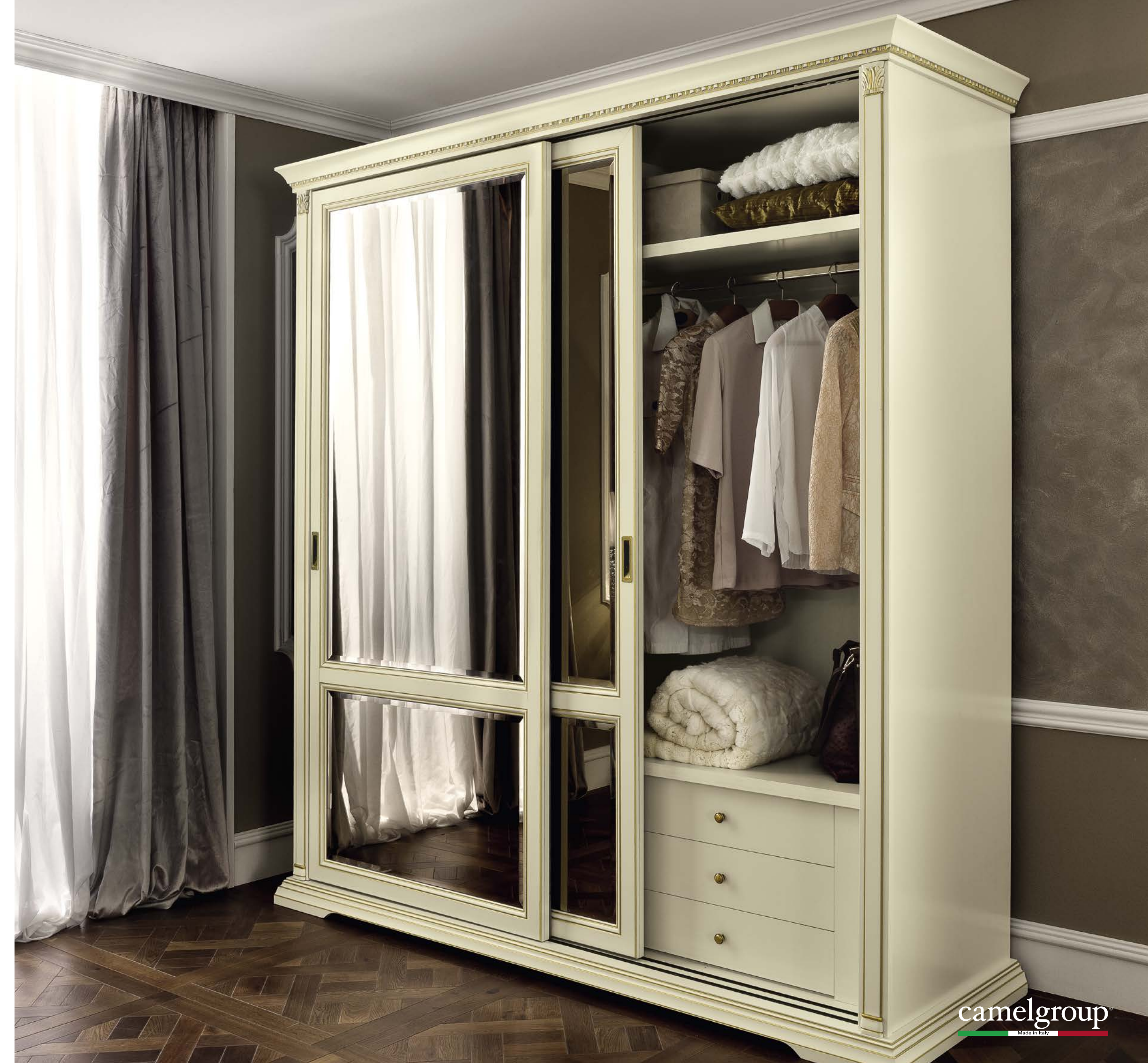
Armadio scorrevole con specchi bronzati e bisellati.

Sliding door wardrobe equipped with bevelled bronze mirrors.