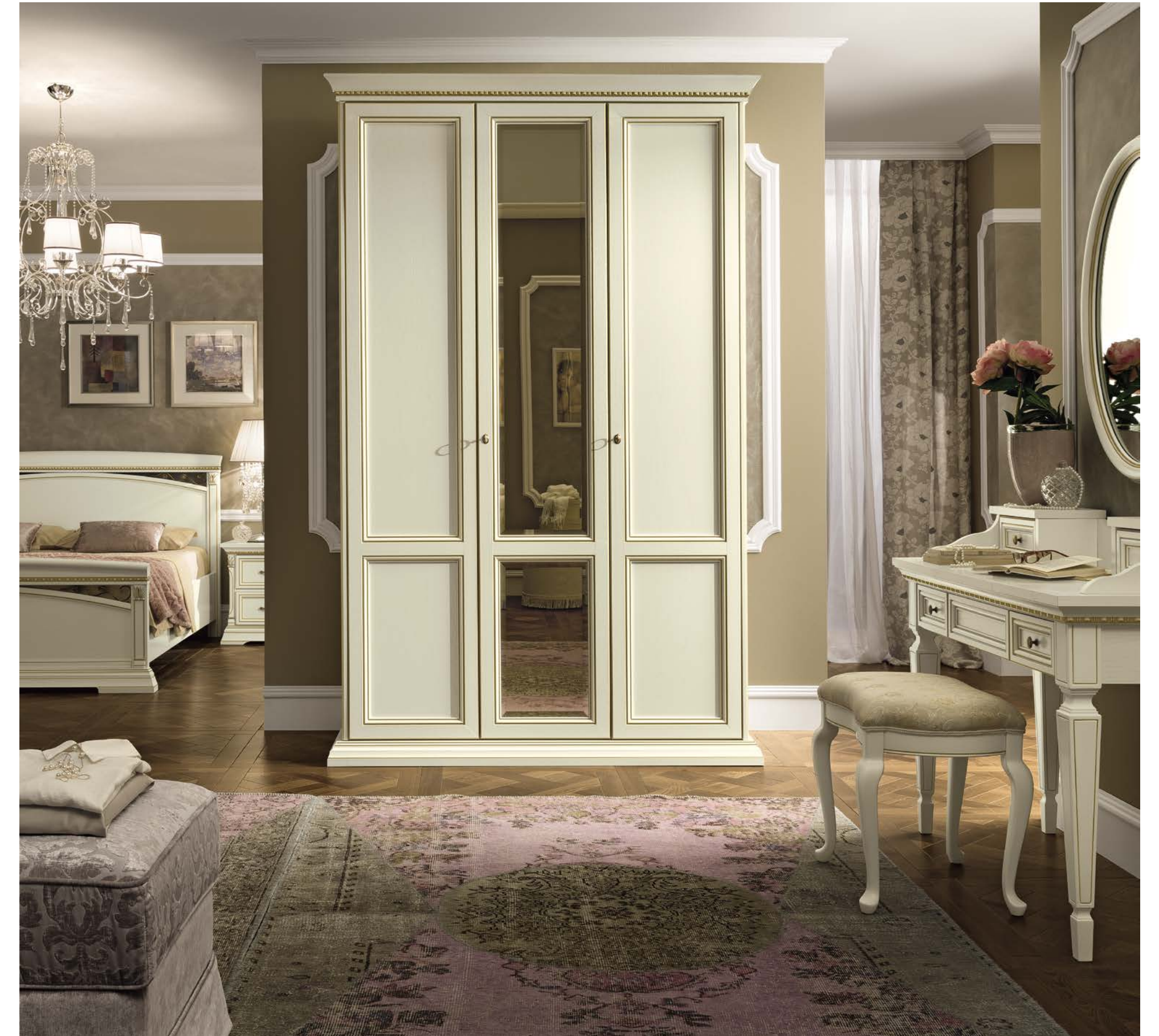
Armadi a tre e quattro ante battenti modulari con specchi bronzati e bisellati.

Three and four door modular hinged wardrobe equipped with bevelled bronze mirrors.