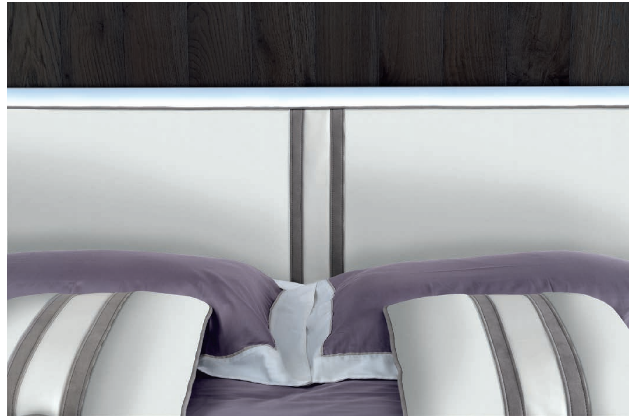
— VANITY LISCIO